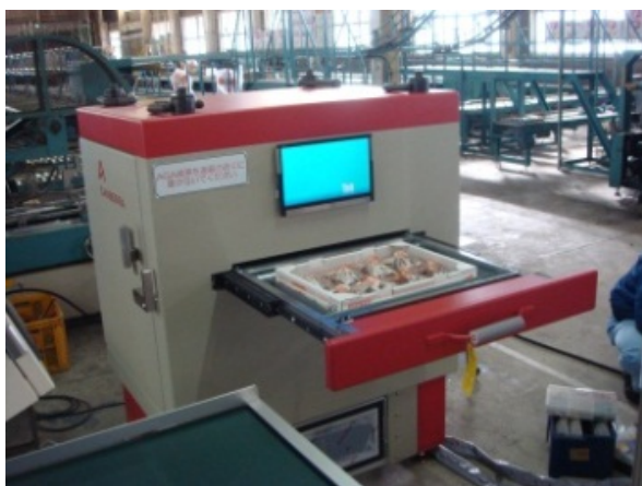
キャンベラジャパン(株)製